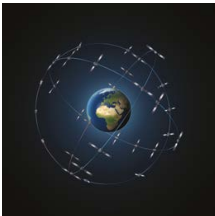
b. Rappresentazione grafica della costellazione di satelliti Galileo (ESA).

X, Y, Z dell'utente) con tre misure a disposizione (i tempi di propagazione dei segnali radio dai tre satelliti all'utente), quindi la sua soluzione è non solo possibile, ma anche semplice.