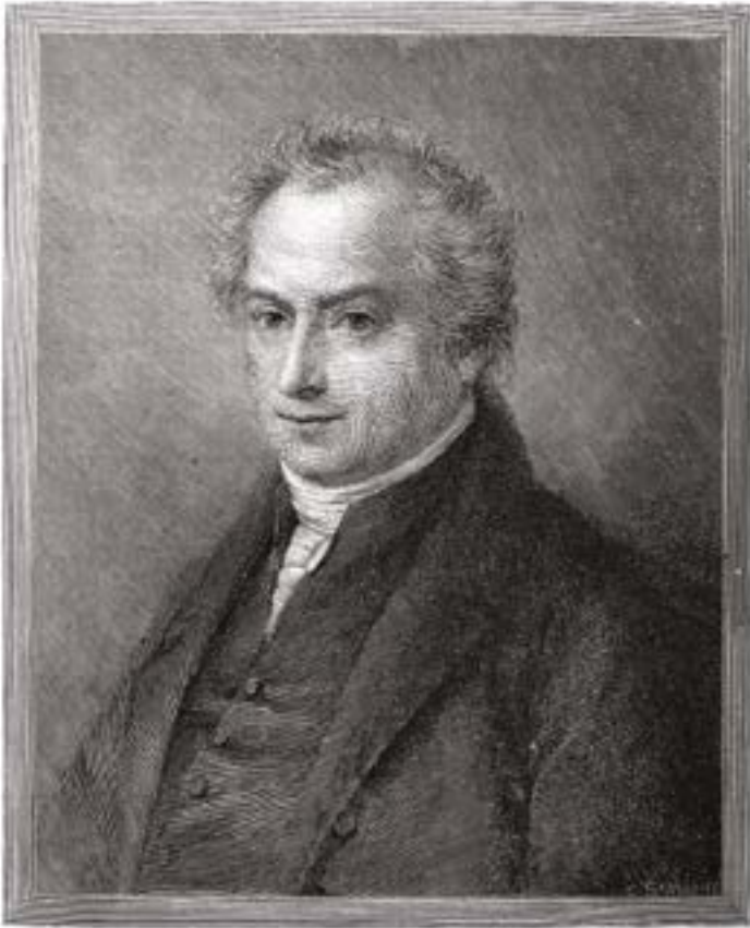
d. Heinrich Wilhelm Olbers (1758-1840) enunciò il paradosso che prende il suo nome per la prima volta nel 1823. Medico di giorno e astronomo amatoriale durante la notte, si dedicò completamente all'astronomia dal 1822.

sembra essere anche l'età di tutto l'universo. La predizione di un universo dinamico di Alexandr Friedmann del 1922, basata sulla relatività generale, fu confermata dalla misura dell'espansione dell'universo a opera di George Lemaître nel 1927 e definitivamente da Edwin Hubble nel 1929. È naturale immaginare che l'origine dell'espansione coincida con la nascita del nostro universo osservabile.