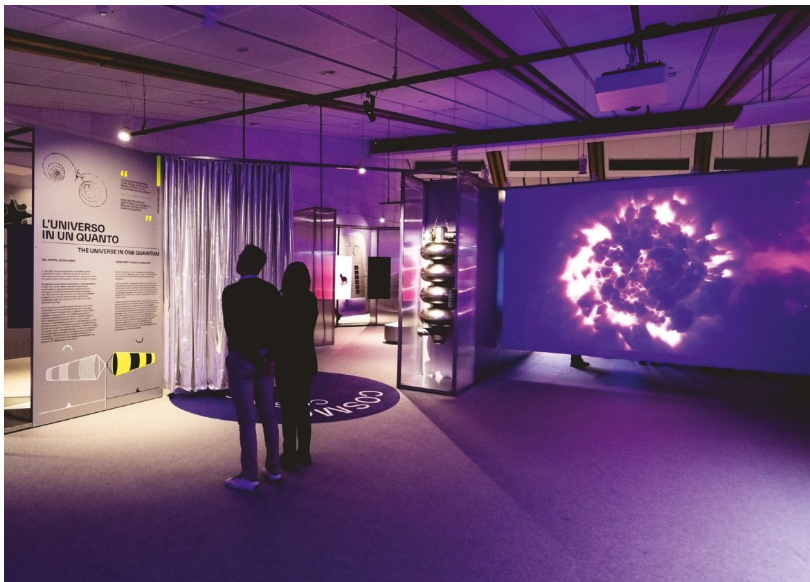
a. Installazioni multimediali interattive, proiezioni immersive, testi e video di approfondimento, exhibit e strumenti della ricerca accompagnano il visitatore in un viaggio attraverso la meccanica quantistica.

Come ogni rivoluzione, anche la meccanica quantistica ha avuto origine da una crisi, la crisi di una descrizione della realtà che a fine '800 sembrava perfetta: la fisica classica, con la meccanica newtoniana e l'elettromagnetismo di Maxwell, che tenevano ben separati il mondo della materia, fatto di corpi che cadono e rotolano, occupano un punto preciso dello spazio e si muovono